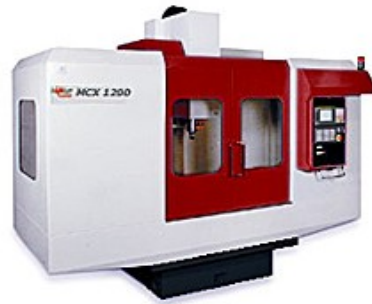
FAMUP MCX 1200